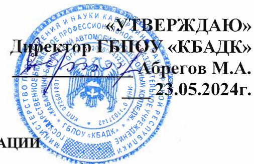
ГРАФИК ПРОВЕДЕНИЯ ГОСУДАРСТВЕННОЙ ИТОГОВОЙ АТТЕСТАЦИИ СТУДЕНТОВ ОЧНОЙ ФОРМЫ ОБУЧЕНИЯ

Специальности 23.02.07 «Техническое обслуживание и ремонт автотранспортных средств»